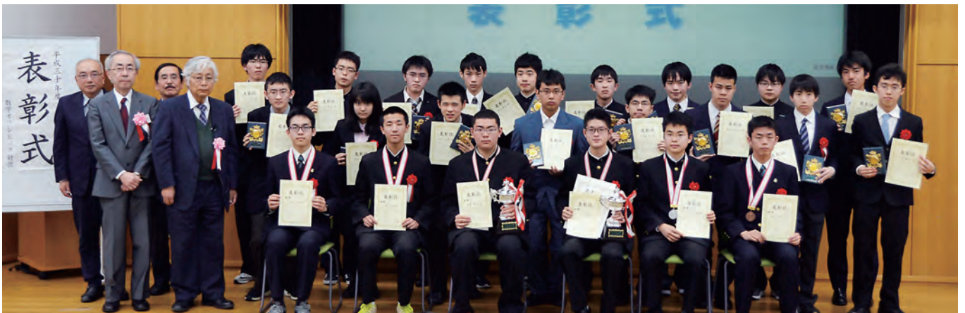
第29回日本数学オリンピック受賞者

最後になりましたが、本大会を主催されている公益財団法人数学オリンピック財団をはじめ、関係者の皆様の御尽力に対して深く敬意を表するとともに、本大会の今後の一層の発展を祈念致しまして、私のお祝いの言葉とさせていただきます。