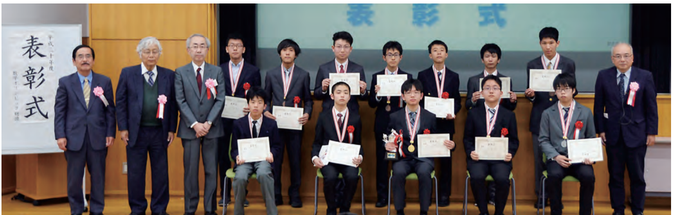
第17回日本ジュニア数学オリンピック受賞者