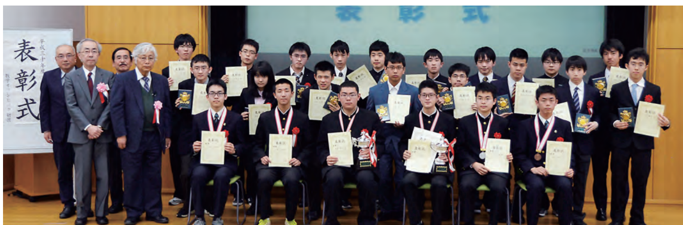
第29回日本数学オリンピック受賞者

最後になりましたが、本大会を主催されている公益財団法人数学オリンピック財団をはじめ、関係者の皆様の御尽力に対して深く敬意を表するとともに、本大会の今後の一層の発展を祈念致しまして、私のお祝いの言葉とさせていただきます。