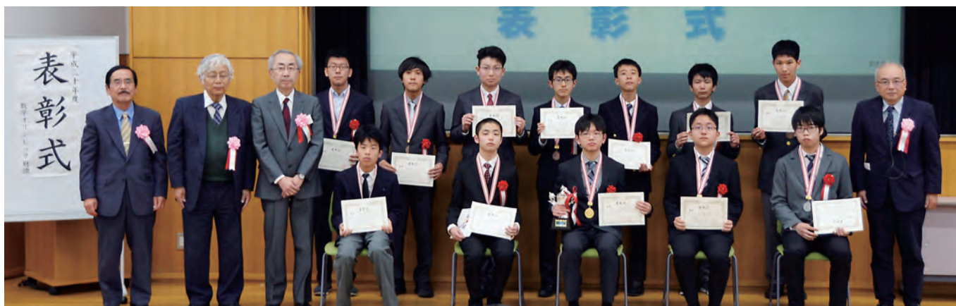
第17回日本ジュニア数学オリンピック受賞者