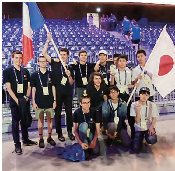
IMO2018ルーマニア大会(国際交流)

〈口座番号〉(普通) 0299549 〈口座名義〉公益財団法人 数学オリンピック財団