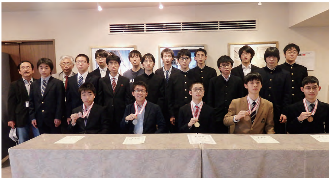
第31回日本数学オリンピック受賞者

第31回JMOの表彰式は、予定していた会場が新型コロナウイルス感染症拡大のため使用できないことになり、代表選考合宿初日(3月20日(土))に開校式と合わせて実施した。